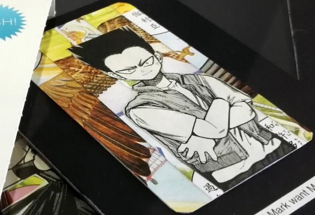
What do you think the w