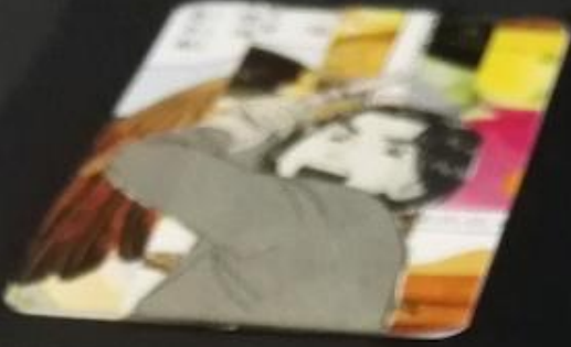
...with long hair's always hard to manage...